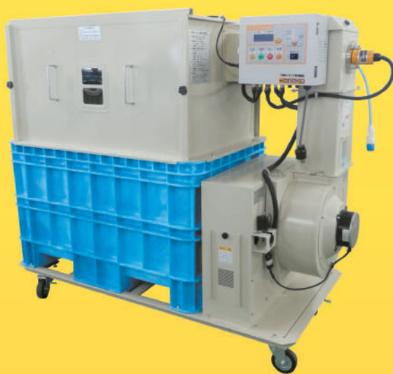
●ビートルJr. HFD055 最大 処理量 50kg