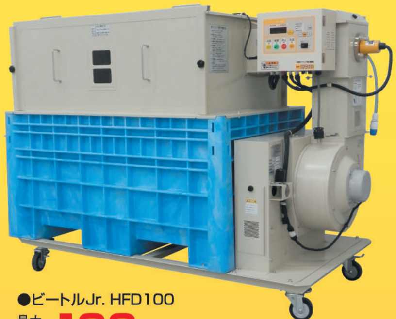
●ビートルJr. HFD100 最大 処理量 100kg