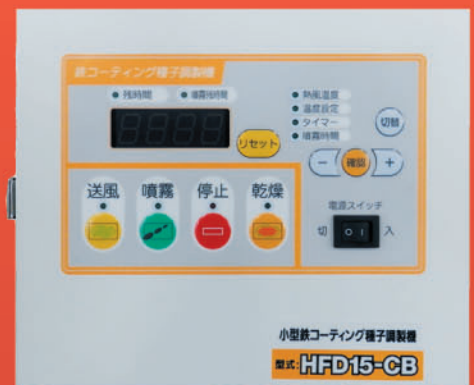
操作簡単!コントローラー (HFD15-CB)